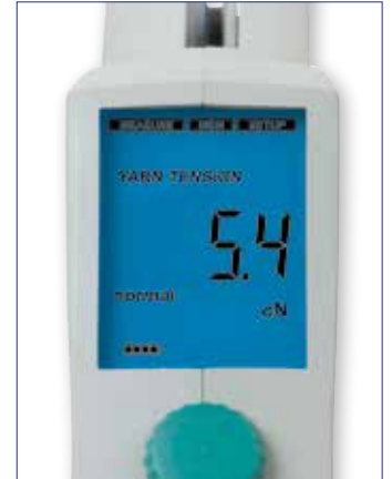
Tension du fil