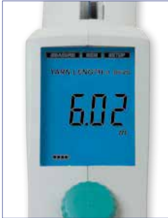
Consommation de fil