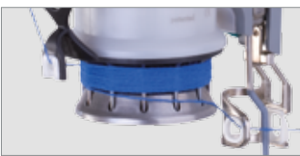
Bobine d'enroulement ouverte